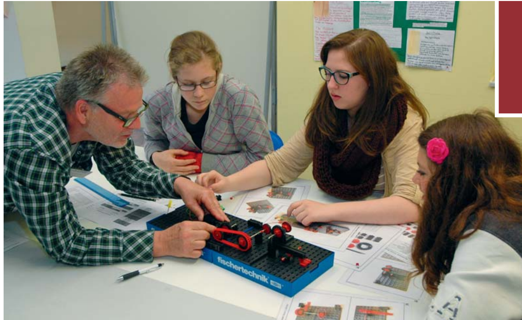
Während einer Potenzialanalyse lernen Schülerinnen und Schüler ihre Stärken und Interessen kennen. Solche Analysen führt das Bildungszentrum im Rahmen des Programms „Kein Abschluss ohne Anschluss“ (KAOA) durch.