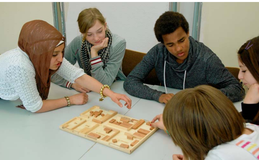
Zur Potenzialanalyse gehört auch eine Gruppendiskussion.

Eine wichtige Aufgabe sehen die Geschäftsführer im Landesprojekt „Kein Abschluss ohne Anschluss“ (KAOA). Künftig erhalten alle nordrhein-westfälischen Schülerinnen und Schüler ab der 8. Klasse eine verbindliche und systematische Berufs- und Studienorientierung – und zwar unabhängig von der Schulform, die sie besuchen. In der Region Mittlerer Niederrhein hat die Umsetzung in diesem Jahr begonnen. Bis 2017 soll das System in ganz NRW eingeführt werden, dann sind auch alle fast 200 Schulen in der Region dabei. Im Rahmen