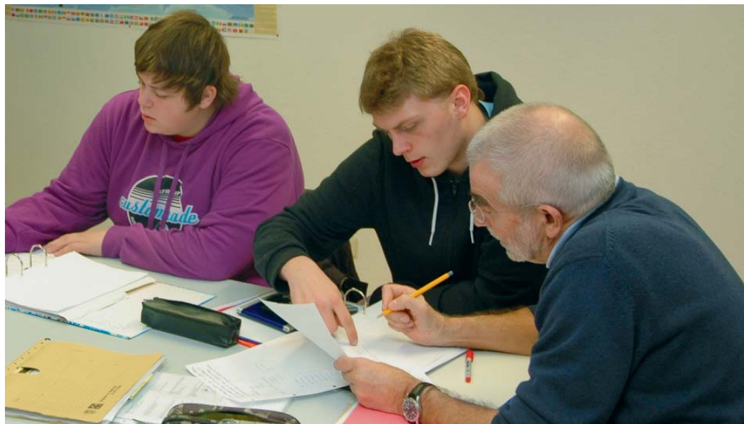
Damit Jugendliche ihre Ausbildung schaffen, können sie beim Bildungszentrum Niederrhein gezielten Nachhilfeunterricht erhalten.

Auch bei einem weiteren neuen Programm ist das Bildungszentrum Niederrhein dabei. Die Arbeitsagentur hat die sogenannte „Assistierte Ausbildung“ eingeführt. Die Idee: Jugendliche ohne oder mit schwachem Schulabschluss oder junge Menschen mit Migrationshintergrund sollen eine Chance erhalten, ihr Können unter Beweis zu stellen. Sie haben, so die Arbeitsagentur in einer Information für Betriebe, „oft mehr drauf, als es auf den ersten Blick scheint. Denn nicht immer spiegeln sich ihre Kompetenzen in Schulnoten und Zeugnissen wider.“ Im Rahmen der „Assistierten Ausbildung“ werden sowohl die Auszubildenden als auch die Unternehmen von einem Mitarbeiter des Bildungszentrums intensiv und kontinuierlich begleitet. Die jungen Menschen erhalten Hilfen, damit sie Sprach- und Bildungsdefizite ab- und fachtheoretische Kenntnisse und Fertigkeiten aufbauen können. Gleichzeitig werden die Betriebe bei der Verwaltung, Organisation und Durchführung der Ausbildung unterstützt. Wie das in der Praxis